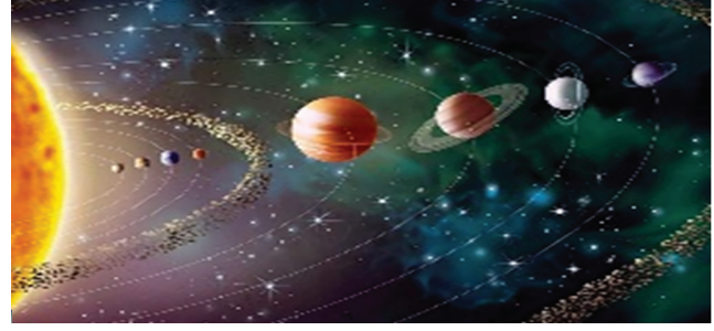
II. Evrenin yaratılması