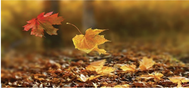
III. Sonbahar olunca ağaçların yapraklarını dökmesi