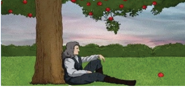
I. Yer çekimi kanunu