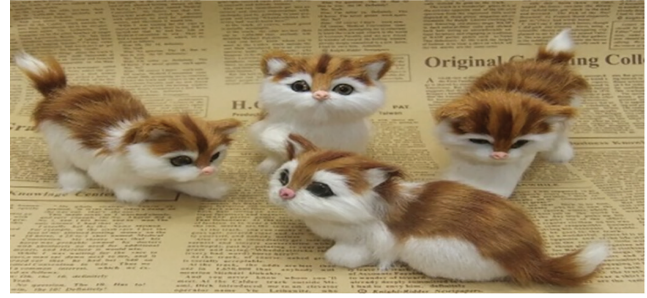
IV. Vakti gelince hamile olan bir kedinin doğum yapması

Yukarıda verilen örneklerden hangileri “kader ve kaza” kapsamında değerlendirilir?